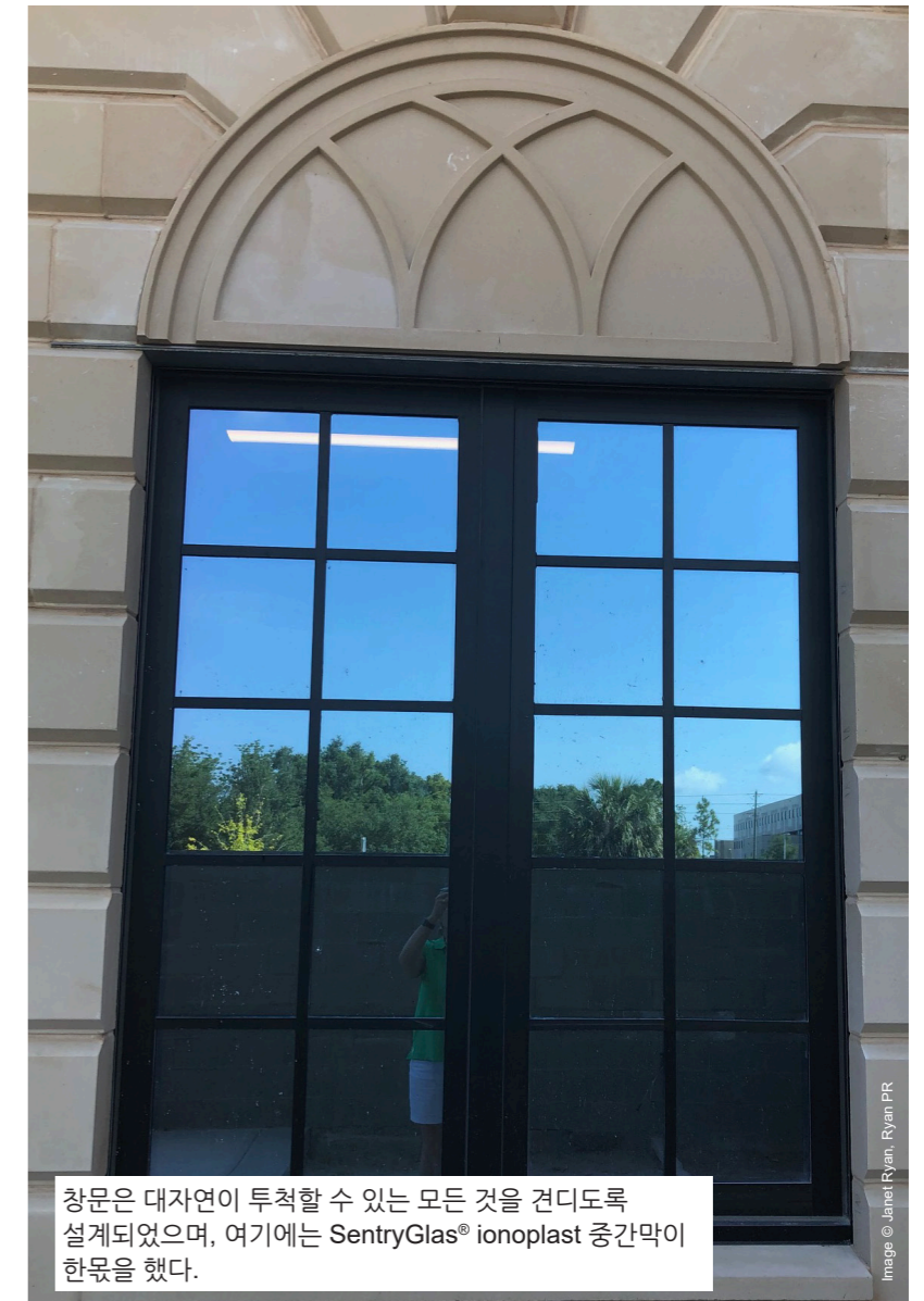
창문은 대자연이 투척할 수 있는 모든 것을 견디도록 설계되었으며, 여기에는 SentryGlas® ionoplast 중간막이 한몫을 했다.

3,716m 2 규모의 시설에는 WINCO의 프레임과 접합유리 글레이징을 다양하게 활용했다. WINCO의 3350 시리즈 고정창은 FEMA P-361 규정(토네이도와 허리케인 안전설: 주민 및 주택 안전설 지침서, 제3판 2015년)의 준수를 시험 및 확인한 제품이다. 이 창문은 시속 160km로 날아드는 5x10cm 크기의 6.8kg 목재를 견딜 수 있다.