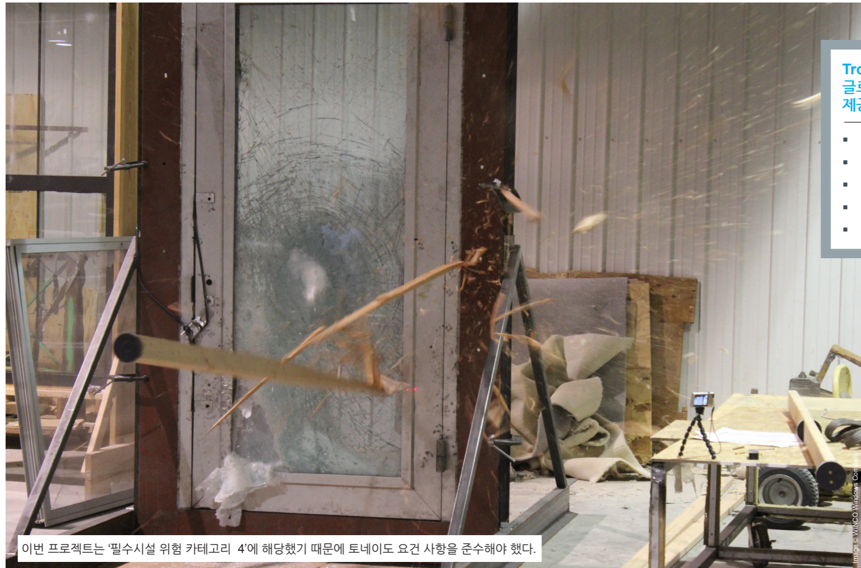
이번 프로젝트는 '필수시설 위험 카테고리 4'에 해당했기 때문에 토네이도 요건 사항을 준수해야 했다.

Trosifol은 건축 분야 접합 안전 유리용 PVB 중간막 및 ionoplast 중간막 분야의 글로벌 리더입니다. 다양한 제품 포트폴리오를 갖춘 Trosifol은 탁월한 솔루션을 제공하고 있습니다.