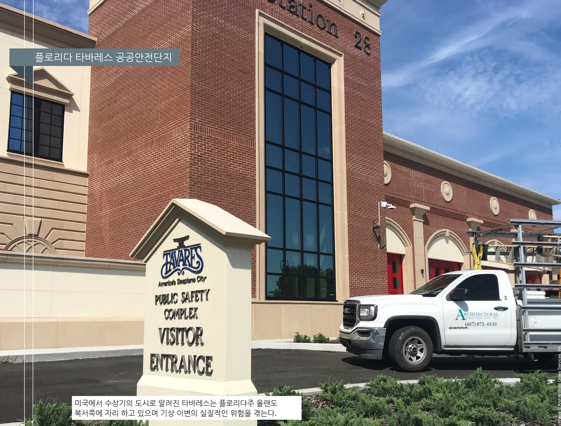
미국에서 수상기의 도시로 알려진 타바레스는 플로리다주 올랜도 북서쪽에 자리 하고 있으며 기상 이변의 실질적인 위험을 겪는다.