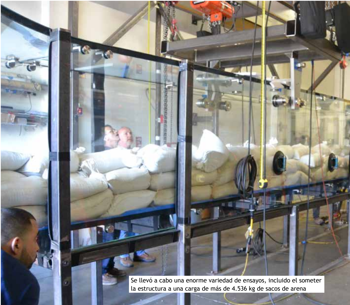
Se llevó a cabo una enorme variedad de ensayos, incluido el someter la estructura a una carga de más de 4.536 kg de sacos de arena

elevadas y una impresionante estabilidad post rotura — si el vidrio se rompe todavía soportará cargas importantes.”