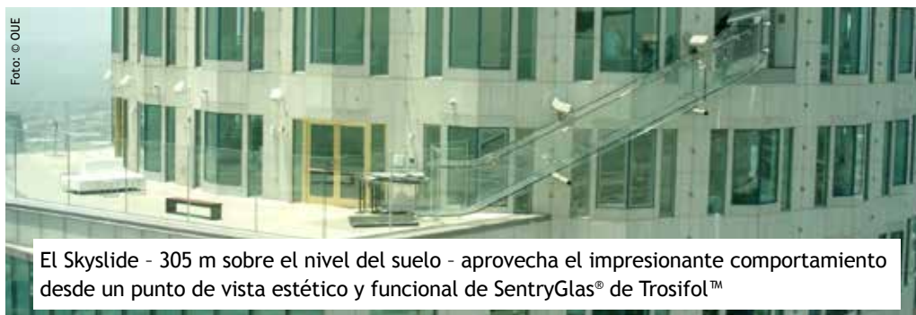
El Skyslide - 305 m sobre el nivel del suelo - aprovecha el impresionante comportamiento desde un punto de vista estético y funcional de SentryGlas® de Trosifol™

Las ‘experiencias emocionantes’ y atracciones acristaladas en altura se están volviendo cada vez más populares en estructuras en altura; y su viabilidad se ve reforzada por las propiedades de que dotan las tecnologías contemporáneas a las interláminas junto a una fabricación y concepto de montaje avanzados. El Skyslide (tobogán aéreo) es un ejemplo de un propietario de un edificio que no solo proporciona una atracción y un tema de conversación, pero además una fuente de ingresos adicional - y existen muchas ideas similares en proceso alrededor del mundo. Todas estas ideas tienen en común la necesidad de materiales que no solo aporten propiedades estructurales superiores y mejoren los niveles de seguridad, sino además una transparencia y resistencia máximas en condiciones medioambientales y geográficas extremas. Es por estas razones que Trosifol™ está asistiendo a un creciente interés por parte de diseñadores y arquitectos en su tecnología para interláminas, especialmente SentryGlas® y Trosifol® Extra Stiff, que han evidenciado con regularidad sus capacidades en un número considerable de estas aplicaciones de perfil más exigente.