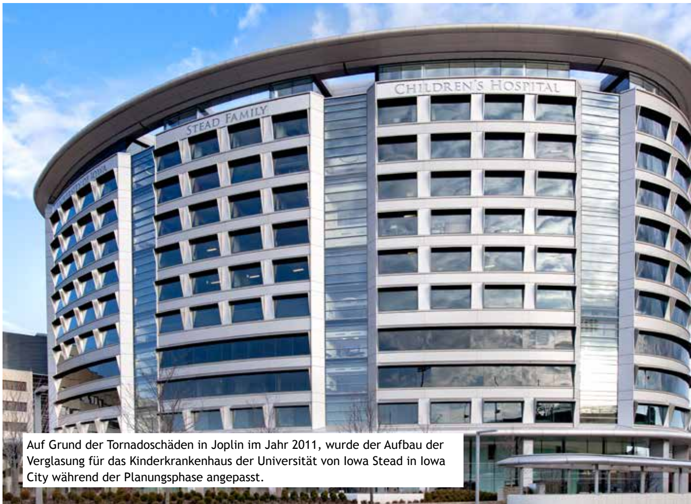
Auf Grund der Tornadoschäden in Joplin im Jahr 2011, wurde der Aufbau der Verglasung für das Kinderkrankenhaus der Universität von Iowa Stead in Iowa City während der Planungsphase angepasst.

Der Schutz vor Tornados umfasst drei Hauptaspekte: eine Konstruktion, die der Einwirkung von Windlasten widerstehen kann, geeignete Fundamente oder Anker, sowie ausreichender Widerstand gegen auftreffende Trümmer, speziell bei Verglasungen und vorgehängten Fassaden. Der sogenannte missile Test für tornadosichere Verglasungen stellt wesentlich höhere Anforderungen als entsprechende Tests für hurrikansichere Verglasungen. Während letztere einem Projektil mit einer Masse von 4,1 kg mit den Abmessungen 5 x 10 cm und einer Geschwindigkeit von 55 km/h widerstehen müssen, gelten für tornadosichere Systeme die erhöhten Werte 6,8 kg, 5 x 10 cm und 160 km/h.